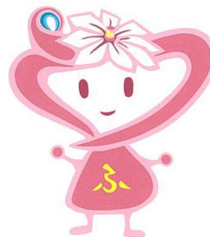
イメージキャラクター ふ~ちゃん