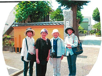
男小生の名欠席残念!!